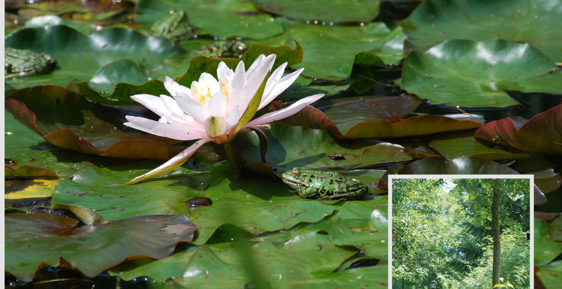
Jakobsweiher im Kurpark