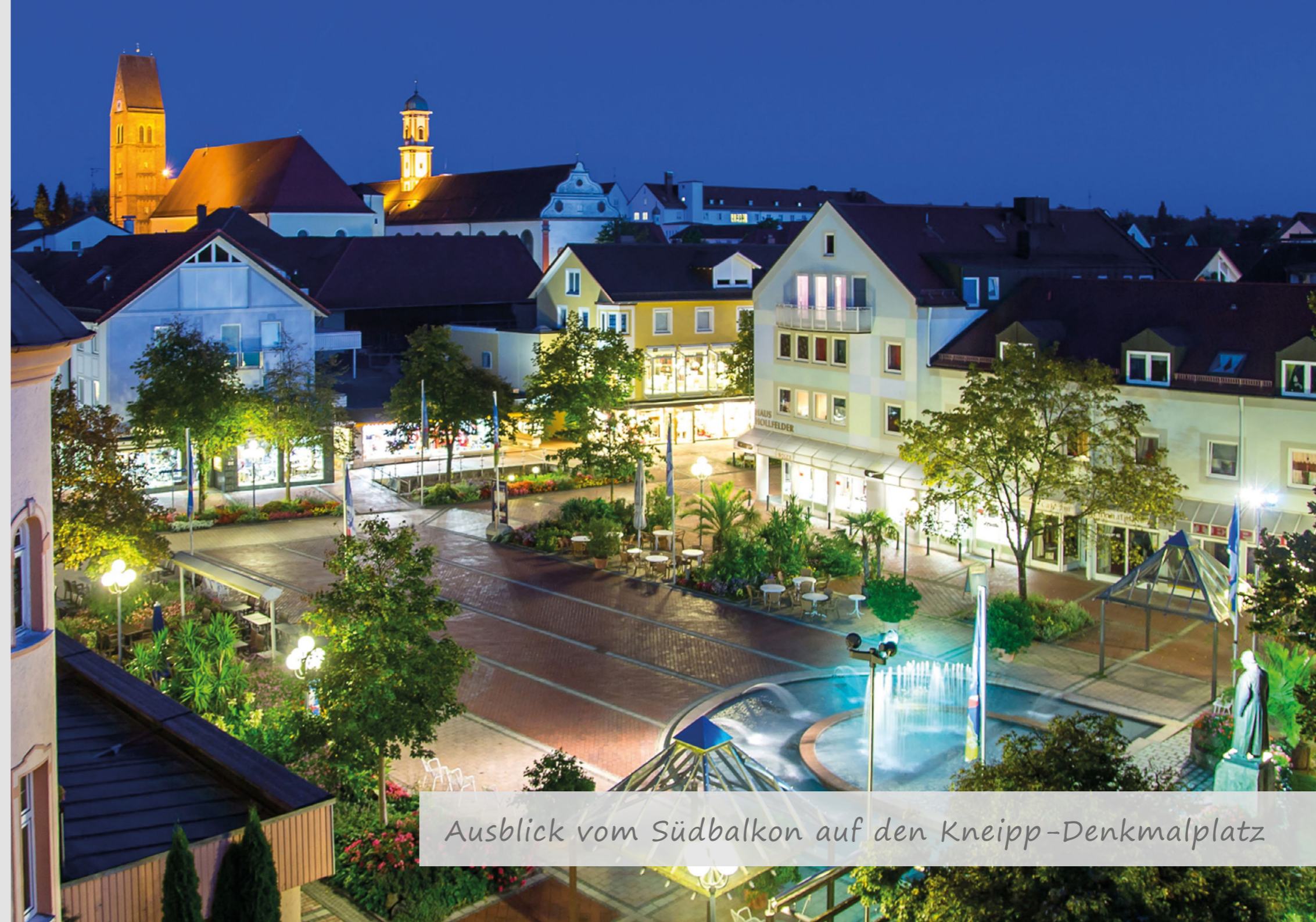
Ausblick vom Südbalkon auf den Kneipp-Denkmalplatz

www.stoecklin-reisen.ch oder Telefon +41 (0) 61 693 3007 (Basel)